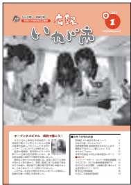
先月までの 表紙デザイン

日頃、皆さんから寄せられているご意見や、今年3月に行った市民アンケートの結果を参考に、広報いが市の紙面を一新しました。分かりやすくてためになる、そして皆さんに愛される広報紙になるよう工夫しています。変更点は次のとおりです。