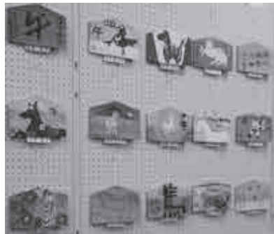
▲2014年への思いを形にした絵馬を展示しました。