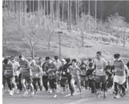
◀大山田温泉さるびのを次々に出発する参加者

2014年の幕開けとなったこの日、たくさんの人が参加し、健康的な1年のスタートを切りました。