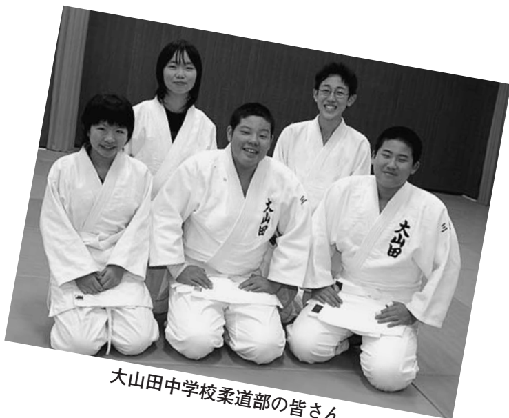
大山田中学校柔道部の皆さん