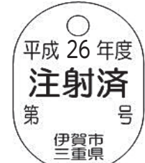
《サイズ》 横 18mm × 縦 25.2mm