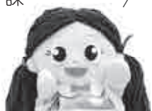
▲行政情報番組の「こども広場」に出演するしのちゃん