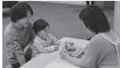
▲ 3歳児健診の歯科相談

※1歳6カ月児健診・3歳児健診の日程は、広報いが市の毎月15日号をご覧ください。(対象児に個別で通知)