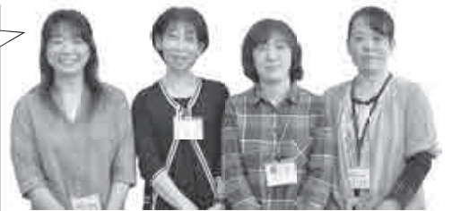
▲健康推進課保健師