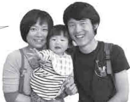
▲ 1歳6カ月児健診に参加していた親子