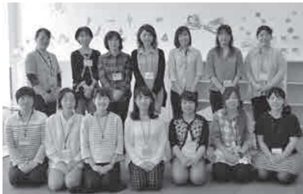
▲ハイトピア伊賀にある伊賀市保健センターの保健師・子育て包括支援センターの保育士と職員

今回は出会いから、就学前の子育てまでを切れめなく支援する、さまざまな事業をご紹介します。 これらの事業や支援機関を活用して、伊賀市で素敵な出会いを見つけ、楽しく子育てをしていただけるよう、市はこれからも支援を続けていきます。 【問い合わせ】 ○健康推進課 ☎ 22・9653 FAX 22・9666 ○子ども未来課 ☎ 22・9677 FAX 22・9646 ○保育幼稚園課 ☎ 22・9655 FAX 22・9646