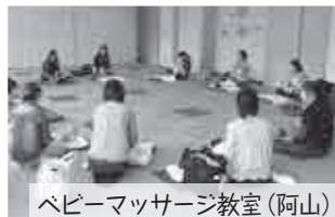
ベビーマッサージ教室(阿山)