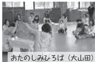
おたのしみひろば(大山田)