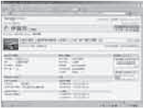
▲差押不動産のインターネット公売