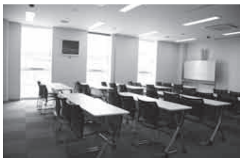
▲ ミーティングルーム