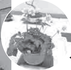
◀力作の絵画や書道、大切に育てられた山野草などが並べられ、訪れた人の目を楽しませました。