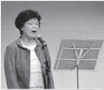
◀詩吟同好会が、伊賀の名所旧跡を「伊賀の宝」と題して吟じました。

2日間で、舞台・フロア部門と展示部門あわせて19サークルが参加し、日頃の成果を披露しました。