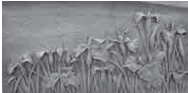
◆ 彫塑工芸部門 市長賞 「花しょうぶ」 辻中静夫