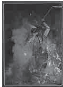
◆ 写真部門 市長賞 「炎の舞」 藤里和也