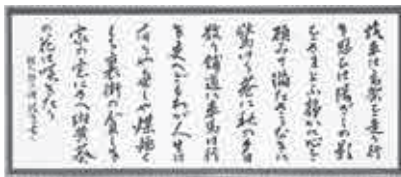
◆ 書道部門 市長賞 「萩原朔太郎の詩」 河口玻光