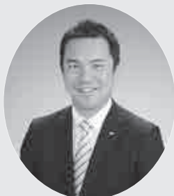
三重県知事 鈴木 英敬