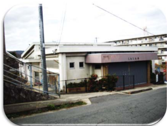
共同浴場しろなみ湯