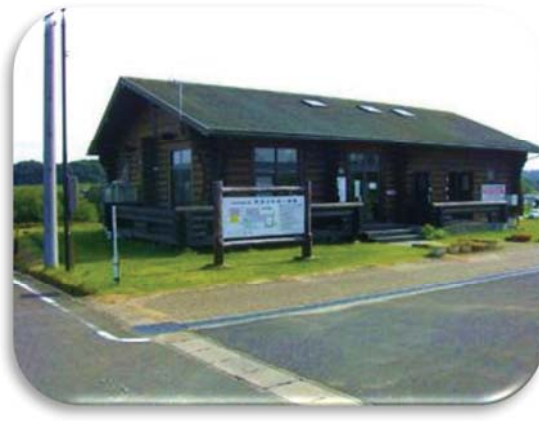
市民農園管理施設