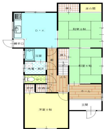
1 階 平 面 図

行政区 柘植町(小林区) 小学校区 伊賀市立柘植小学校 中学校区 伊賀市立柘植中学校