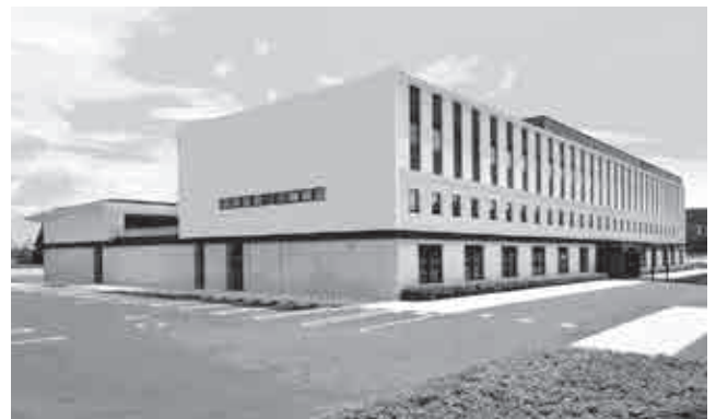
▲伊賀市消防本部新庁舎