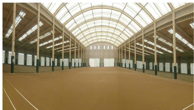
内部 (面積: 4,540.59㎡)