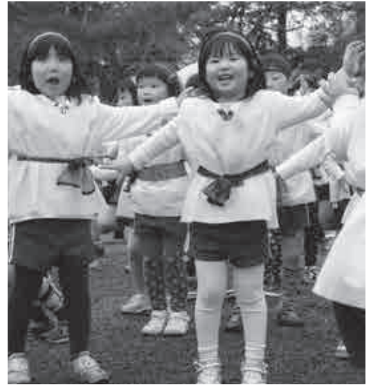
◀▲忍者をイメージした衣装を着てダンスを踊る子どもたち