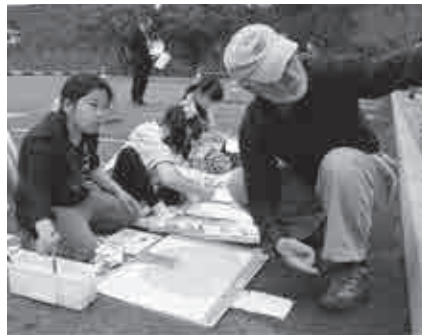
▲講師のアドバイスを受けている様子 ◀真剣な表情で桜の木を観察し、下絵に色を塗りました。