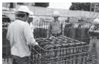
◀基礎の鉄筋を検査する様子