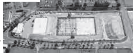
▶西側上空からの航空写真

工事の進捗状況は、新庁舎建築工事特設ホームページで公開していますのでご覧ください。