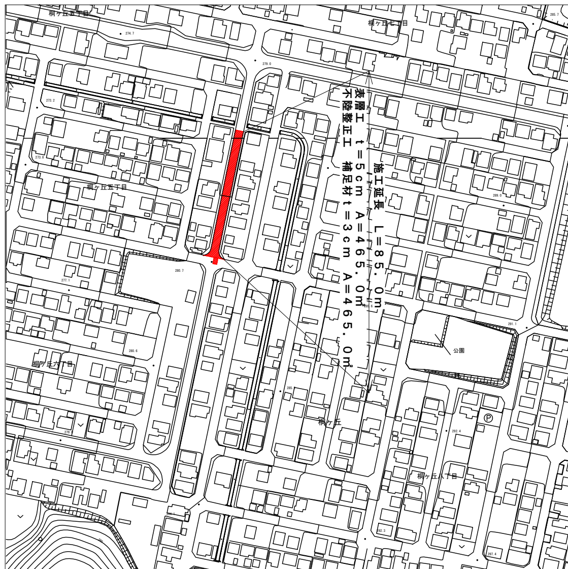
平面図 S=1: 2000