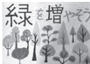
【中学生の部】 市長賞 竹永 早那