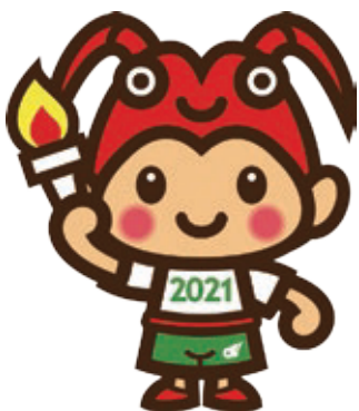
▲大会マスコットキャラクター「とこまる」

◆マスコットキャラクター「とこまる」 三重県を代表するトップブランドのひとつでもある伊勢えびをモチーフにしています。