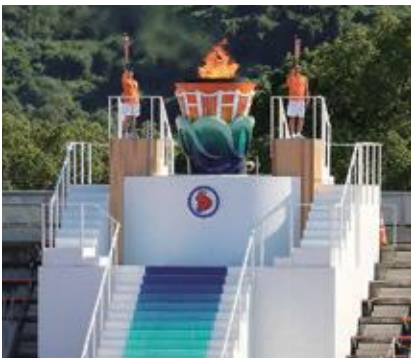
※写真は昨年度開催のえひめ国体の様子

2021年に三重県で第76回国民体育大会「三重とこわか国体」が開催されます。三重県では、1975年の第30回大会以来46年ぶりの開催となります。