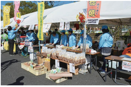
▲地元の産品が販売されました。