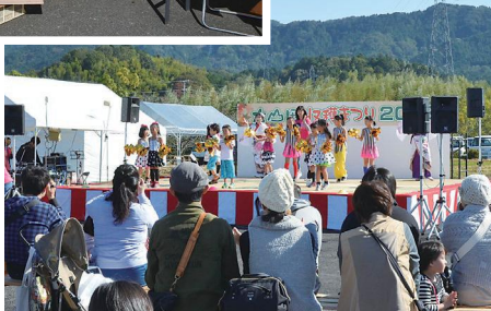
▶ステージには多くの観客が集まりました。