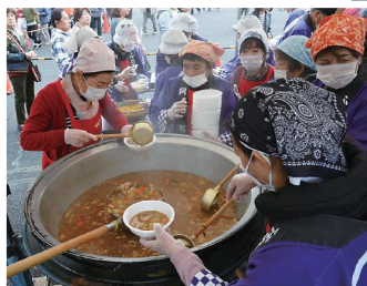
◀大きな鍋で 500 人分のなんば汁が作られました。