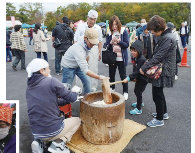
▶来場者がもちをつく様子

まつりの名物は大鍋料理。今年は地元産の野菜や豚肉のほかに、アクセントとしてトウモロコシが散らされた「なんば汁鍋」が用意され、買い求めた人たちは、温かい鍋料理をおいしそうに食べていました。