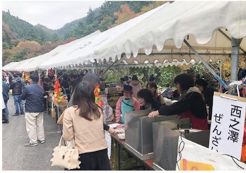
◀たくさんの出店が並びました。