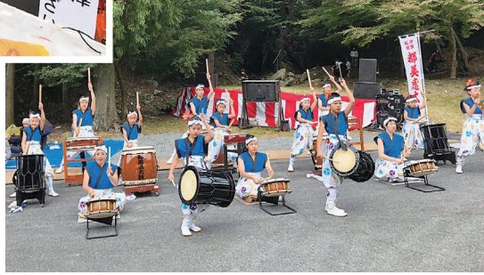
▶都美恵太鼓による演奏の様子