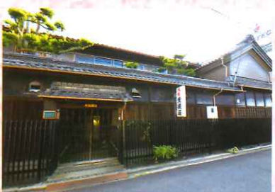
㉑ 旅館薫楽荘本館ほか