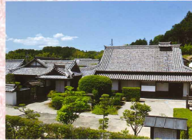
町井家住宅主屋・書院(国重文)