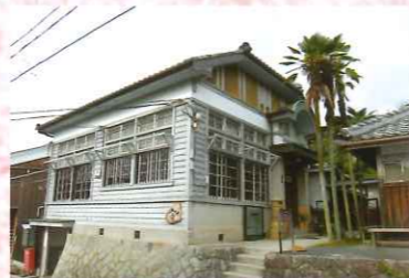
③7 長谷園大正館・登り窯・主屋・別荘・離れ・蔵ほか