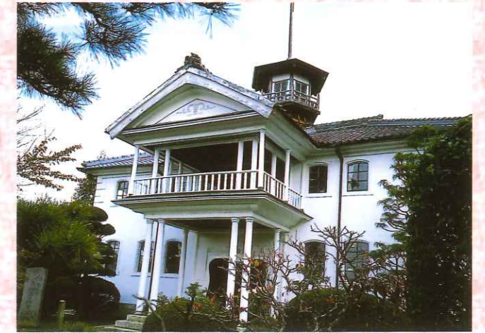
旧小田小学校本館(県指定)