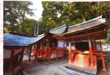
②9 高倉神社本殿・境内社八幡社本殿・境内社春日社本殿