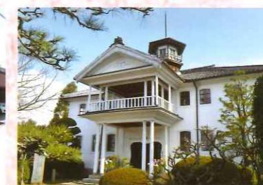
㉔ 旧小田小学校本館