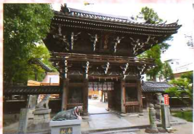
⑪ 菅原神社楼門・鐘楼