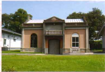
②6 上野市上水道水源地送水機関室