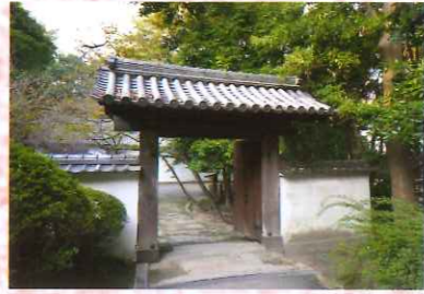
⑤ 藤堂家所縁御殿の御門