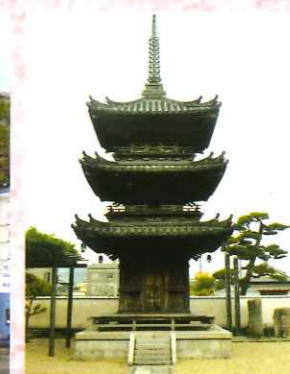
㉕ 開化寺三重塔ほか