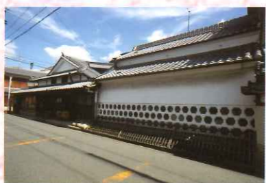
⑯ 寺村家住宅・前蔵