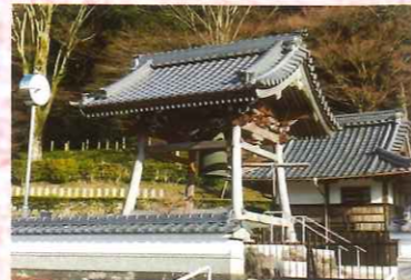
③3 鐘楼と梵鐘(徳永寺)