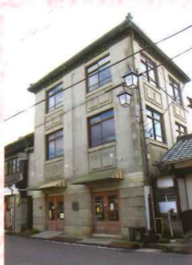
⑬ 上野文化センター