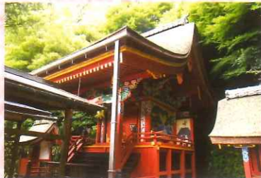
③1 猪田神社本殿(下郡)