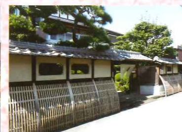
㉓ 旧料理旅館九重本館ほか