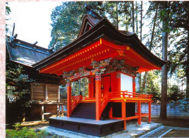
大村神社宝殿(国重文)