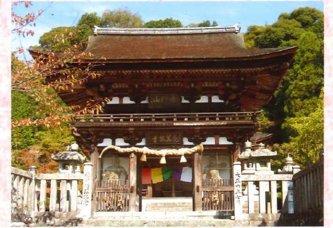
観菩提寺楼門(国重文)

伊賀市には、地域の宝物として誇るべき文化財がたくさんあります。なかでも建造物は、神社の本殿や寺院の本堂・門、武家屋敷や学校校舎など、さまざまな種類のものがあり、市内各所で見るすることができます。また、伊賀市は戦災を受けなかったことから、室町時代から江戸時代、明治・大正・昭和と、各時代の建造物が残されているのが大きな特徴です。伊賀市は、県内の国重要文化財・県指定有形文化財の3割、国登録文化財の2割が所在する文化財建造物の宝庫ともいえる地域です。