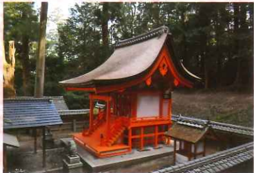
③0 猪田神社本殿(猪田)