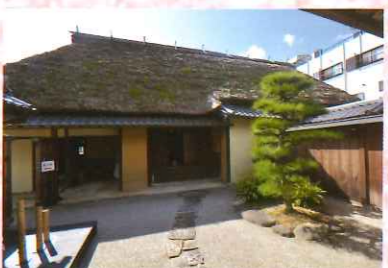
⑭ 入交家住宅主屋ほか