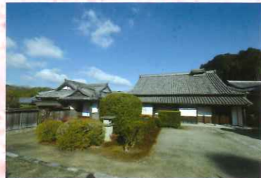
③2 町井家住宅主屋・書院