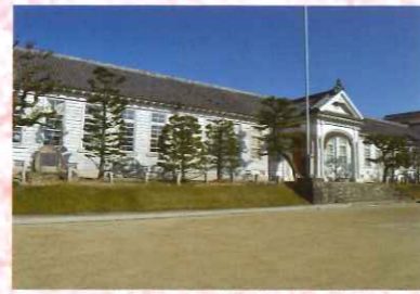
③ 旧三重県第三尋常中学校校舎