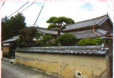
⑩ 中森家住宅主屋ほか