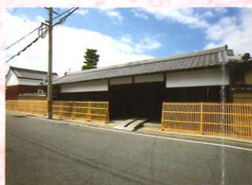
⑱ 赤井家住宅主屋ほか