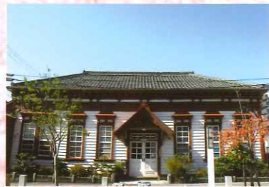
⑨ 北泉家住宅主屋(旧上野警察署)