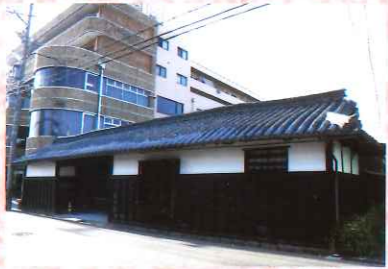
⑦ 成瀬平馬家長屋門