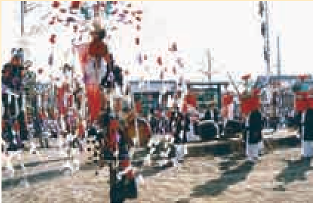
▲勝手神社の神事踊

神事踊は、明治40年までは陰暦6月13日に山畑の津島神社において祇園祭神事花踊として行われ、雨乞祈願、悪疫平癒祈願などのために行われたと聞いています。この踊りは中世から今日まで人々が伝えてきた風流踊りといわれる芸能のひとつで、長い間地域において人々に伝承されてきた華やかで意匠のおもしろさのある踊りです。現在は合祀された山畑の勝手神社の祭礼で行われています。