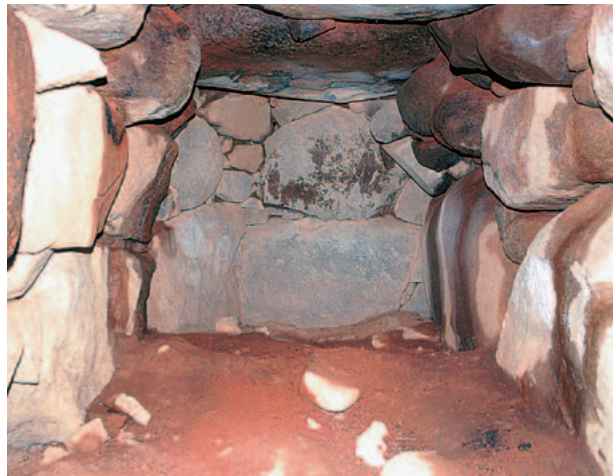
玄室入口から奥壁を撮影

1977年に皇學館大学考古学研究会によって測量調査が実施され、東西14メートル・南北18メートルの墳丘を有し、巨大な横穴式石室は、玄室長5.8×6.2メートル、奥室幅2.2メートル、玄室高2.1メートルの規模であることが明らかにされました。細長い玄室は基本的に石材を2段に積み上げて構築していて、側壁は基底部に巨石をそれぞれ3石配し、その上方にやや小振りの石材を積み上げ、大型の天井石を3石架けているようです。