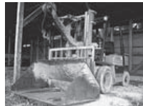
▲トヨタ フォークリフト