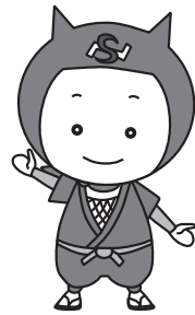
▲伊賀市の介護予防キャラクター にんサポくん