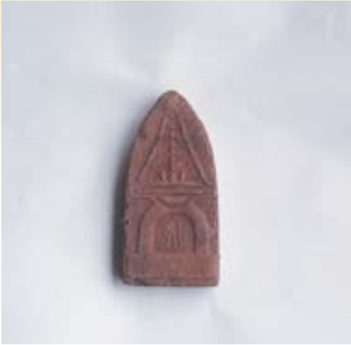
▲將軍塚出土の泥塔

昭和55年、円徳院字川原地区の圃場整備事業に伴い同地にある二基の將軍塚において試掘調査が実施されました。