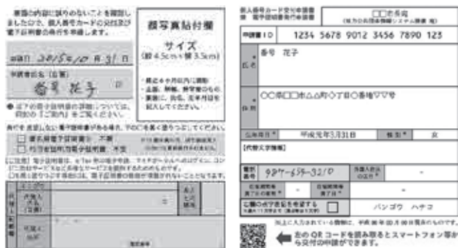
▲個人番号カード交付申請書(裏)