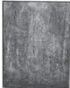
◆絵画部門 市長賞 「室生幻想」 西良三