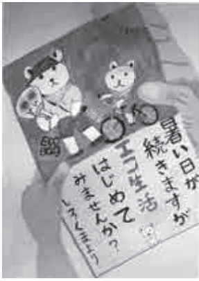
▶福壽武俊さんの作品