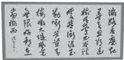
◆書道部門 市長賞 「干謙詩」 河口波光