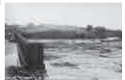
▲昭和46年 台風29号の被害