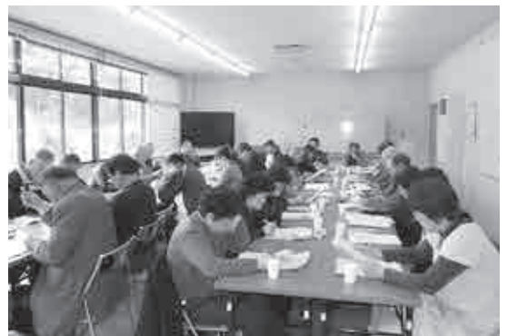
▲協議会を立ち上げるため話し合う神戸地区の皆さん

3ページ「支援のしくみ」で第3層の福祉区に分類される住民自治協議会では、地域ケアネットワーク会議などの支援の体制づくりがすすめられています。神戸地区住民自治協議会では、平成25年に神戸地区支え合いネットワーク協議会の立ち上げをめざして地域福祉について考える場作りに取り組んでいます。