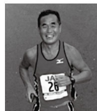
■ゲストランナー 高石ともやさん (フォークシンガー)