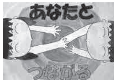
▶ 2014年度「ポスター部門・小学生の部」市長賞受賞作品

人権政策・男女共同参画課（大山田農村環境改善センター内）、各支所振興課（上野支所を除く。）