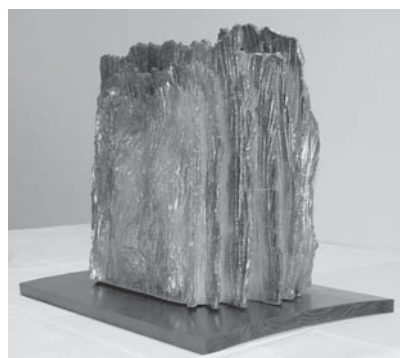
◀市長賞(彫塑工芸) 「地震」