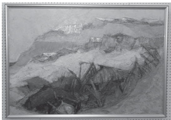
◀市長賞(絵画) 「地震のあとに」

期間中は、入賞・入選作品と審査員などの作品を含む絵画部門70点、彫塑工芸部門58点、写真部門58点、書道部門32点の合計218点を展示しました。各部門の市長賞の作品と入賞者(敬称略)の方々をご紹介します。