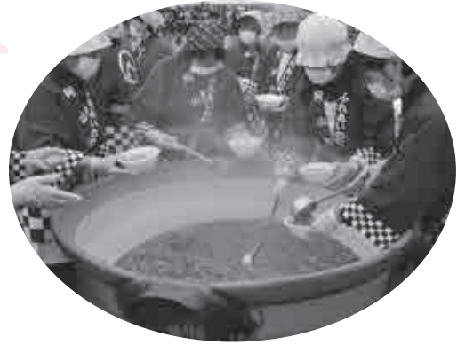
▲地元の野菜をふんだんに使った「豚ずい」の大鍋料理。500食用意され、おとずれた人は舌鼓を打っていました。 ～けんずいまつり～