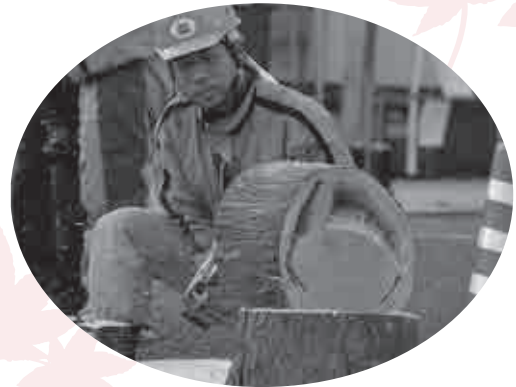
▲チェーンソーアートでは、さまざまなチェーンソーを巧みに使い分け、イスやウサギをかたどったオブジェなどが作られました。 ～ふれあいフェスタ in 青山～