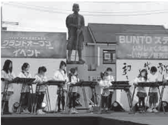
◀コンテストで大正琴の演奏を披露する子どもたち

またハイトピア伊賀や栄楽館では、伊勢型紙や伊賀焼などの体験教室が開かれ、訪れた人たちはさまざまな体験をして楽しみました。