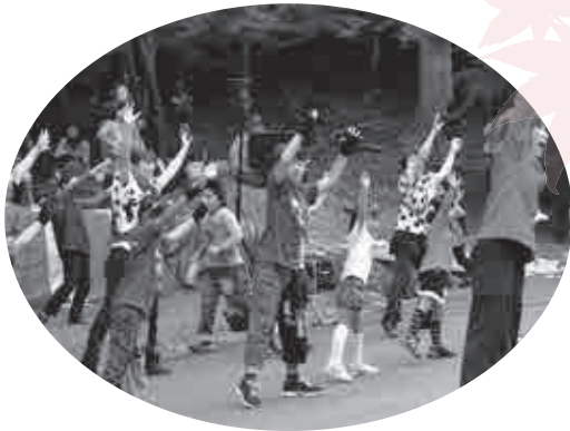
▲WAIWAI 3Bファミリーなどがダンスを披露し、会場を盛り上げました。 ～滝山溪谷紅葉まつり～