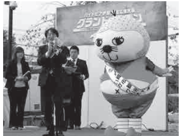
◀伊賀市観光大使就任のあいさつをする「いが☆グリオ」