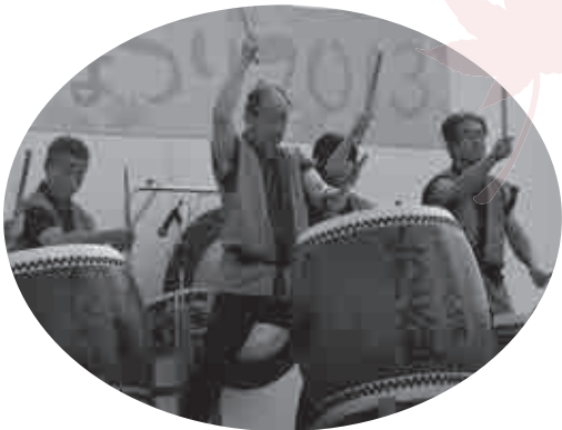
▲ステージでは、伊賀の国大山田くればは太鼓保存会による和太鼓の演奏などが披露されました。 ～大山田収穫まつり～

11月上旬に市内各所で秋まつりが開催されました。ステージではダンスや演奏などが披露され、会場内では特産品の出店などが立ち並び、にぎわいをみせました。どの会場でも、たくさんの方が訪れ、過ぎゆく秋の1日を楽しんでいる様子でした。