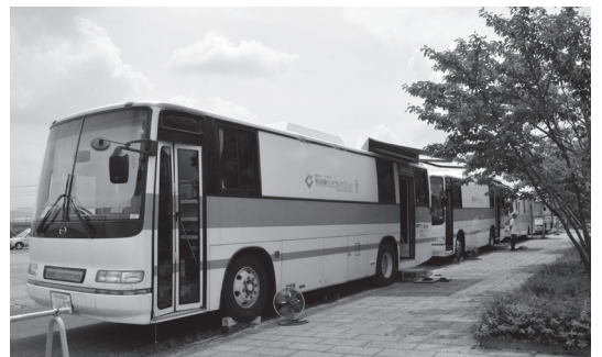
▲集団がん検診の当日は、各検診ごとのバスが並びます。