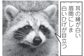
耳の縁が白い 眉窩にしま 白いひげが目立つ