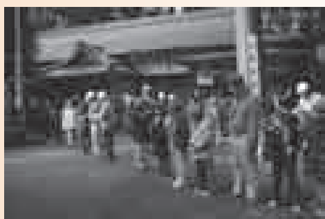
▲文化財防火デー防火訓練（大村神社）