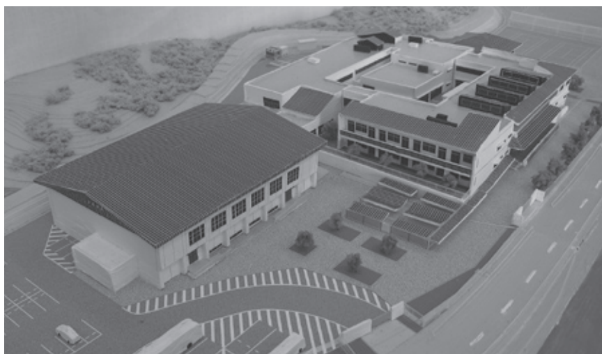
上野南中学校完成模型