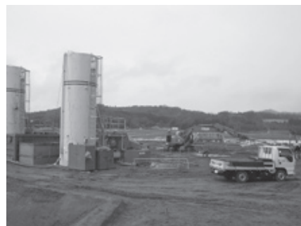
上野南中学校建築工事風景