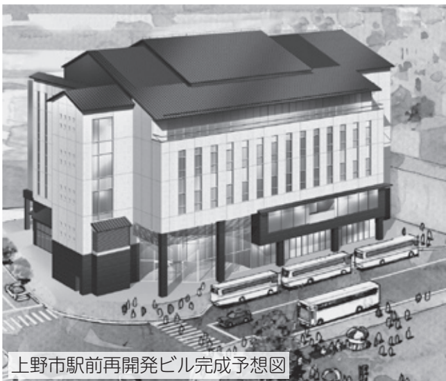
上野市駅前再開発ビル完成予想図

この再開発ビルが、名実ともに、親しまれ愛される施設となることを目的として、ビルの名称と、名称を選考するために設置する「名称選考委員会」の委員として活躍していただける人を募集します。