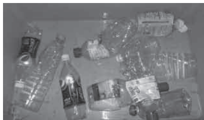
▲ペットボトルに分別されるべき混入物