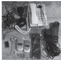
▲金属類に分別されるべき混入物