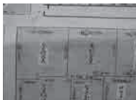
▲侍屋敷に書かれた名前と寸法 から幕府に提出された藤堂藩の公式絵図の写しと考えられます。

平成25年2月、市指定有形文化財(歴史資料)になりました。(二七一五)ごろのものと考えられています。