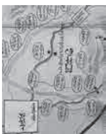
▲阿拝郡と山田郡の一部

ら、元禄13年(一七〇〇)に藤堂藩が幕府に提出した国絵図の控え図と考えられます。伊賀四郡の境や街道、河川などを詳細に示し、四角囲い、丸囲いの文字によって宿場と村の違いを表現しています。また、各村には石高(土地の生産高)が記載されるなど、さまざまな情報が盛り込まれています。