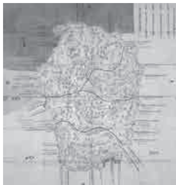
▲元禄13年伊賀国絵図 (大きさ縦 193.5cm・横 186cm)

絵図に「元禄十三庚辰年」と書かれ、また、藤堂藩の歴史をまとめた『宗国史』の元禄13年7月12日条に「伊賀の地図を官に納む」とあることか