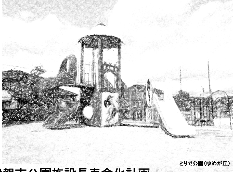
とりで公園(ゆめが丘)