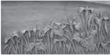
彫塑工芸部門 市長賞 「花しょうぶ」辻中静夫