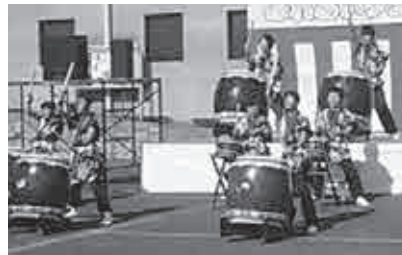
▲青山太鼓保存会による演奏では、メンバーの大きな掛け声とともに会場に鳴り響く迫力ある演奏に、訪れた人から手拍子がおこりました。