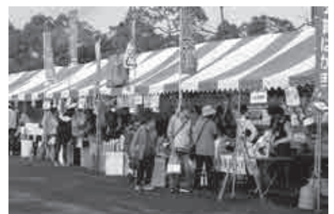
▼会場では、地元の自治会やさまざまな団体が、いか焼きやとうもろこしなどを販売し、大勢の人が訪れました。