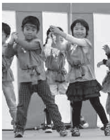
▲大山田保育園の年長児によるかわいらしい忍ジャーズダンス