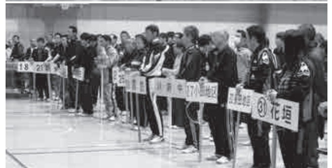
▲卓球会場で開会式に参加する選手の皆さん