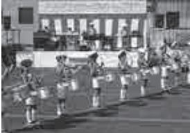
▼青山よさみ幼稚園の年長児による鼓隊演奏

青山支所周辺で、第10回ふれあいフェスタ in 青山が開催されました。会場では、さくら保育園幼年消防クラブによるダンス「ザ・まつり」などが披露されました。そのほかマス釣りなどの体験や、とれたての野菜の販売、地元住民自治協議会のブースなども並び、秋晴れの空の下、多くの人が祭りを楽しみました。