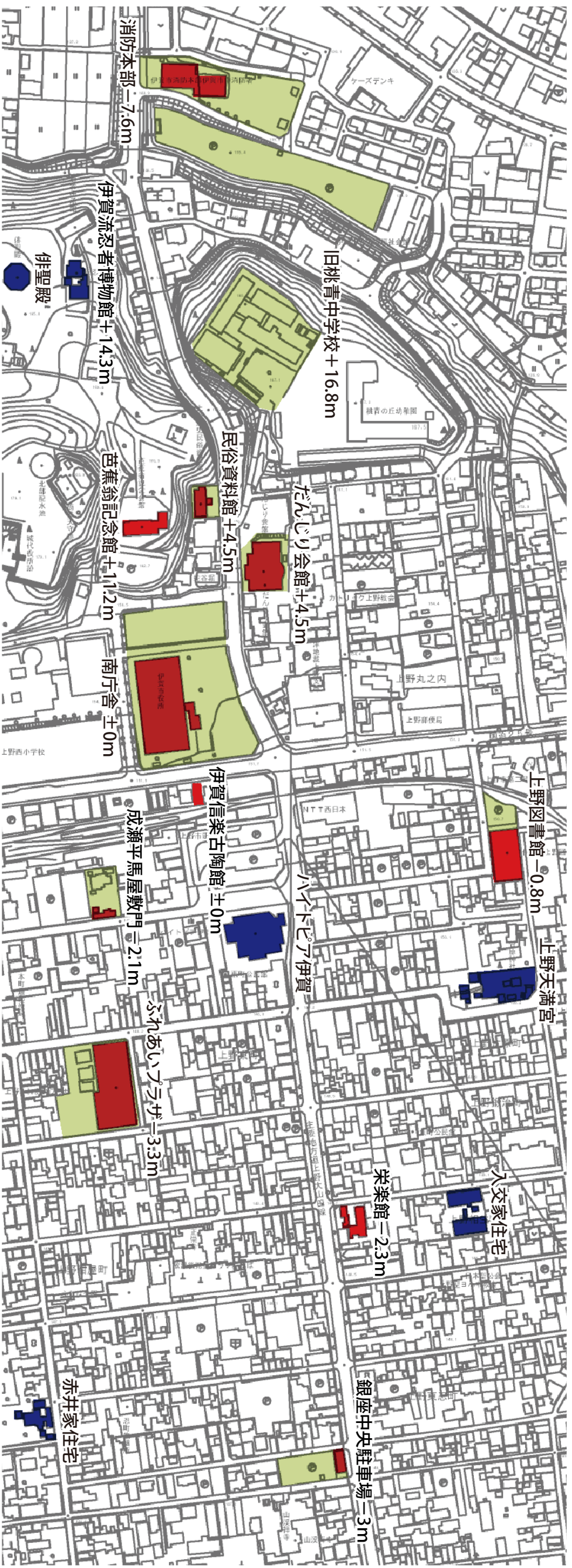
図 中心市街地周辺の断面構成