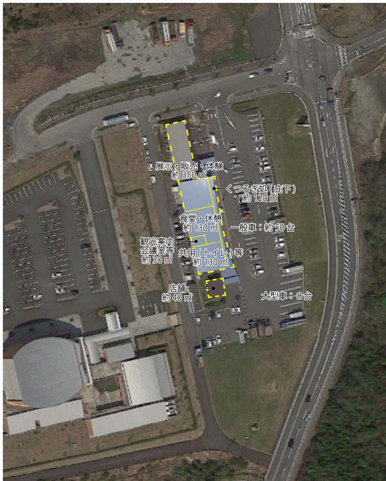
出典：Google マップより (S=1/1000 程度)