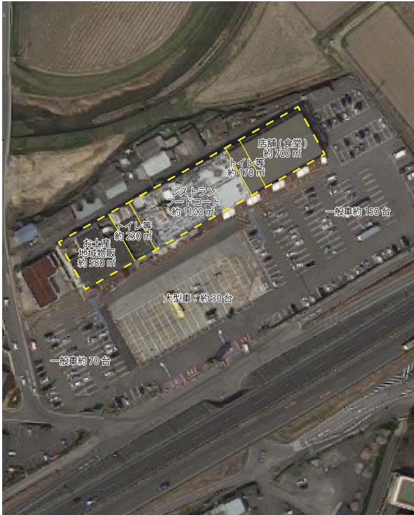
名阪上野ドライブイン：建築面積約 2,800 m 2