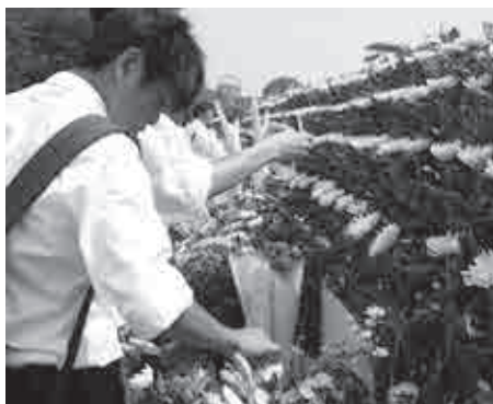
▲式典会場に供えられた花に折り鶴を添える様子。

僕も、その一人として参加させていただき、その場にいた大勢の人の世界平和を祈る気持ちを感じました。