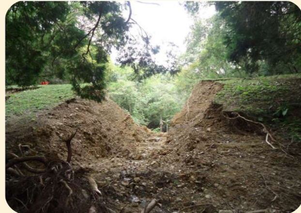
平成25年9月、台風18号による大雨により決壊したため池

ため池は伊賀市に約1,400箇所あり、古くから農業用水の貯水池として利用されてきましたが、その多くは築造から100年以上が経過し、老朽化が進行しています。さらに、近年多発している局地的な大雨や地震などの自然災害が重なることにより、ため池が決壊し、人命や財産などに大きな被害をもたらす危険性が高まります。