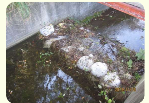
土のうによる洪水吐のかさ上げ

洪水吐に堆積した土砂やゴミ等は、流水断面を阻害し、適切な機能を発揮することができません。また、ため池の貯水を増やすために、洪水吐に土のうを積む様子がよく見られますが、これも危険ですので止めてください。