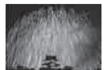
写真（3 枚）： 平成 27 年度の 受賞作品