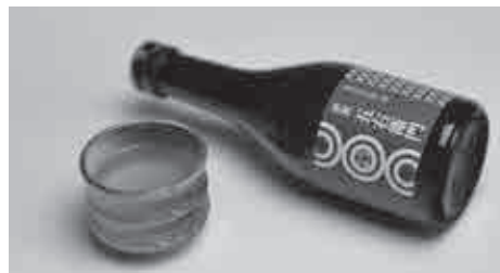
③④株式会社 菊野商店 ☎ 21-0510