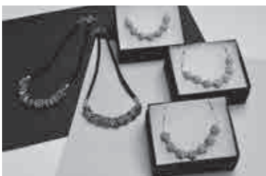
⑦⑧有限会社 平井兼蔵商店 ☎ 21-0666