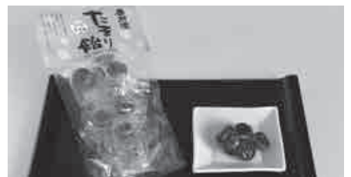
⑥養肝漬宮崎屋 株式会社 ☎ 21-5544