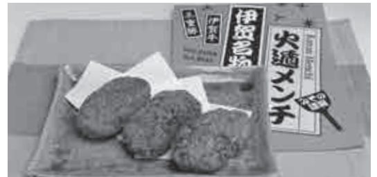
⑱みその謹製 伊賀名物 火遁メンチ