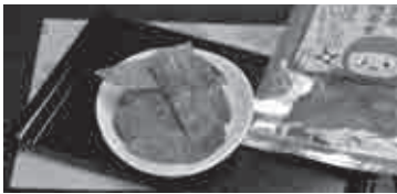
②株式会社 サンショク ☎ 21-2229