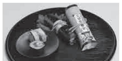
⑨特定非営利活動法人 あわてんぼう ☎ 48-0007