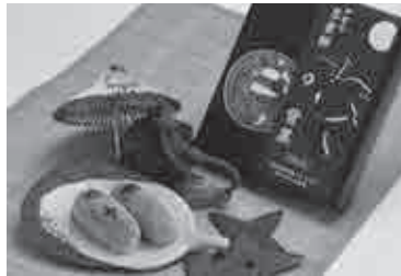
①つばや菓子舗 ☎ 47-0029

伊賀ブランド推進協議会では、伊賀の風土と暮らしが育み、伊賀の匠の知恵と技が結集した優良な伊賀産品とその生産・製造などに携わる事業者を伊賀ブランドに認定しています。 このたび、19の認定品と14の認定事業者を決定しましたので紹介します。