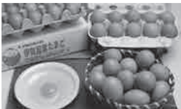
⑤株式会社 岡本養鶏場 ☎ 45-2569