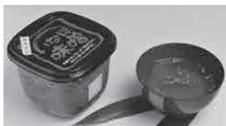
⑩⑪農事組合法人 あぐりぴあ伊賀 ☎ 38-8001